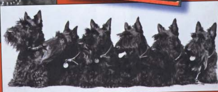
En grupp Kennelgarth-skottar – alla champions!